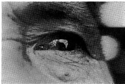
図 2 症例 1 の眼症状，上鞏膜炎

とで検査・加療しているうちに血管炎症状が発見され MRA と診断されたものである．MRA の診断は診断基準によるが，1973 年特定疾患にとりあげられ，その症状と検査所見の特徴が“診断の手引き”にくわしく書かれている 1) ．