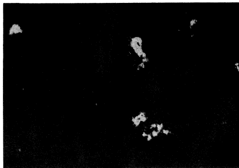
Fig. 2. Fibrin deposits on vessel wall in dermal papillae (Case 5).