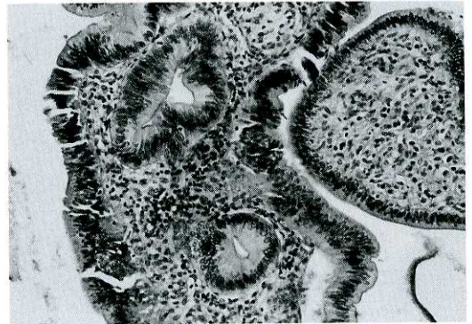
Fig. 5B. An intraductal papillary tumor characterized by high column epithelial cells in which the cell nucleus is regularly localized to the side of the basal membrane. (H. E. \times 100)

より主膵管内の微小病変の発見率は向上している。しかし自験例ではCT, MRCPで主膵管の拡張を認めたものの主膵管内の腫瘤を検出できなかった。この原因としてCT, MRIの分解能の問題もあると考えられたが、本例のCT, MRCPは急性膵炎沈静後に施行されており、腫瘤を検出したUS検査時とは主膵管拡張に差があったことも予想された。それゆえ粘液分泌の少ない微少なIPT症例では主膵管の拡張の程度によればCTやMRCPで良好な腫瘤の検出が得られない可能性もあると考えられた。